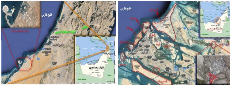
نقشه ۳. جزایر مصنوعی رأس الخیمة و ابوظبی در امارات