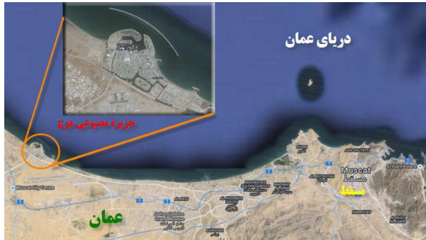
نقشه ۶. جزیره مصنوعی موج عمان: (منبع: نگارنده)