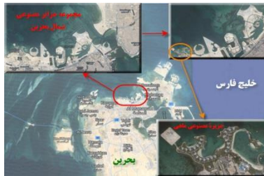
نقشه ۴. جزایر مصنوعی شمال شرقی بحرین (امواج، المحرق و دلمونیا)، جنوب شرقی بحرین (دیورات)، شمال بحرین (ماهی)؛ (منبع: نگارنده)