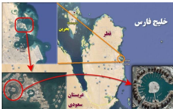
نقشه ۵. جزیره مصنوعی مروارید قطر؛ (منبع: نگارنده)