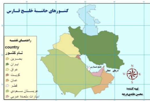
نقشه ۱. محدوده کشورهای مورد مطالعه در حاشیه خلیج فارس؛ (ترسیم: نگارنده)

این پژوهش از نوع کاربردی و از حیث ماهیت براساس روش توصیفی - تحلیلی است. جمع‌آوری اطلاعات نیز با بهره‌گیری از منابع کتابخانه‌ای و اینترنتی و به‌طور خاص سایت رسمی سازمان منطقه‌ای حفاظت از محیط‌زیست دریایی (راپمی) انجام شده است. هم‌چنین برای تهیه نقشه‌های مناطق مورد مطالعه از نرم‌افزارهای ArcMap و Snagit استفاده شده است. هدف پژوهش بررسی نقش و مسئولیت زیست‌محیطی سازمان منطقه‌ای راپمی در برابر احداث جزایر مصنوعی کشورهای حاشیه جنوبی خلیج فارس و دریای عمان است.