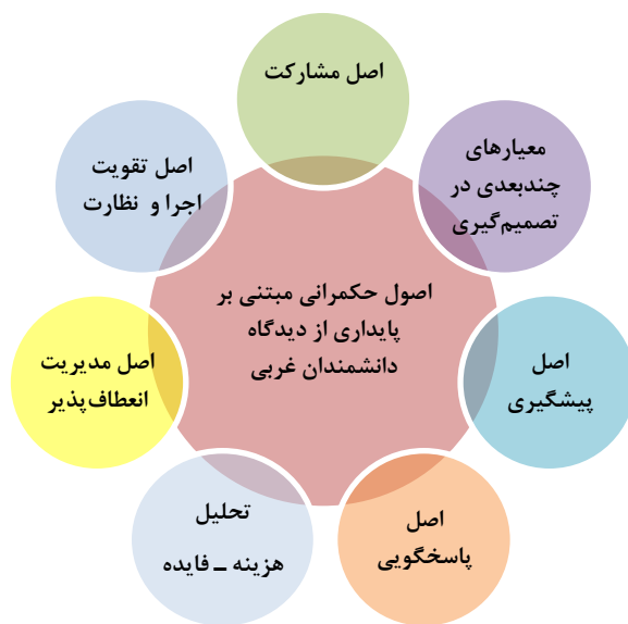
شکل ۱. اصول هفت‌گانه حکمرانی مبتنی بر پایداری از دیدگاه دانشمندان غربی